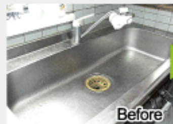
白く曇ってウロコ状の水垢に磨き傷