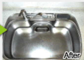
びかびか! 輝き復元!