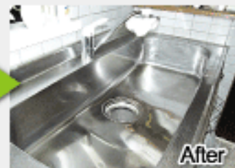
顔すら映りこむほどびかびかに!