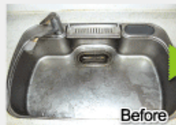
頑固な白く濁った水垢に油膜